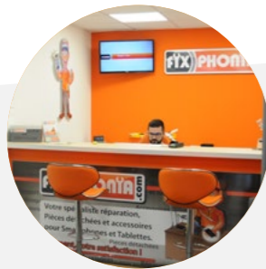
Un Espace accueil intégrant les réparations « minute »