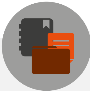
Charte et Plans fournis à la Signature