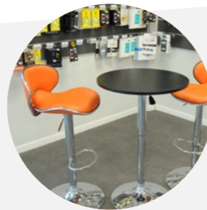
Un Espace attente et détente connecté